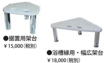
●据置用架台 ¥15,000(税別) ●浴槽緑用・幅広架台 ¥18,000(税別)