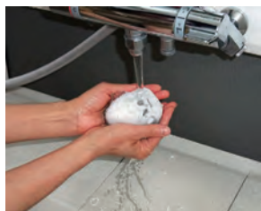
節約宣言 SGR のろ過材

節約宣言のお手入れは一般品に比べ極めて簡単です。吸い込み口のフィルターケースを取り外し、手のひらサイズのろ過材とスポンジをもみ洗いするだけです。しかも運転したままできるので楽々です（プレミアムは運転を停止して本体頭部の各ろ過材を定期的に洗浄）。一般品のように内部を開けての複雑な作業は不要で、簡単なお手入れで済みます。また他社品のように紫外線ランプなどの高額な消耗部品も必要ありません。ろ過フィルター自体に抗菌効果を持たせた画期的な技術により、ろ過フィルターの定期交換だけで制菌効果を維持できます。